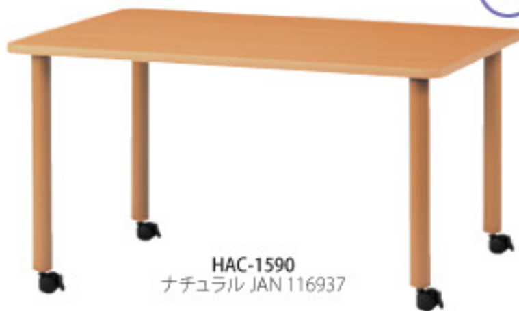
HAC-1590 ナチュラル JAN 116937