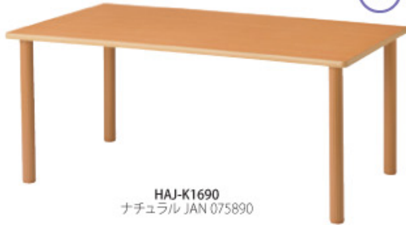
HAJ-K1690 ナチュラル JAN 075890