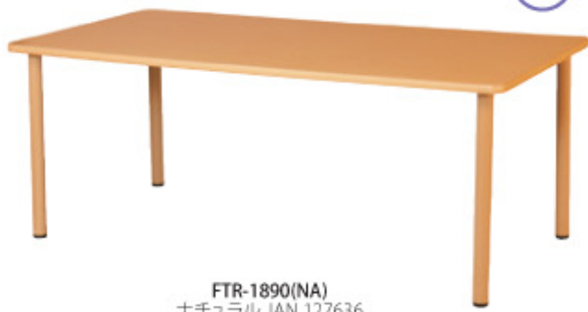
FTR-1890(NA) ナチュラル JAN 127636