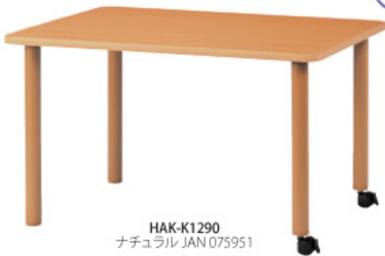
HAK-K1290 ナチュラル JAN 075951